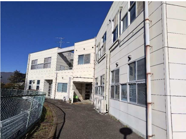
⑧ 特別作業 (クーラー配管)