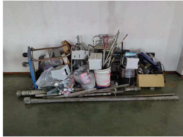
⑥ 金属くず (金属類)