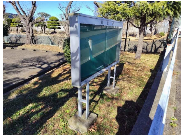
⑧ 特別作業 (掲示板)