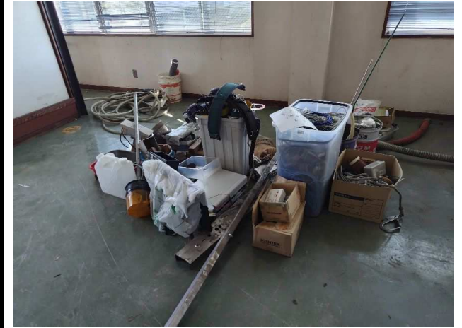
⑦ 廃プラ類 (不燃混合物)