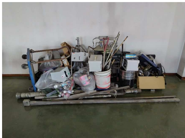
⑥ 金属くず (金属類)