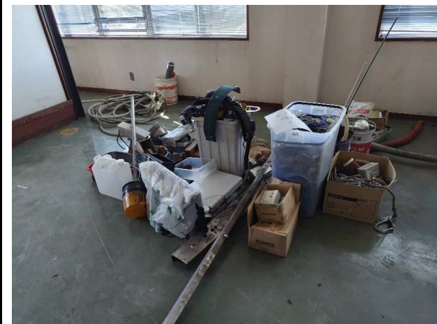
⑦ 廃プラ類 (不燃混合物)